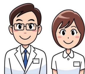
聖マリアヘルスケアセンター 患者サービス委員会